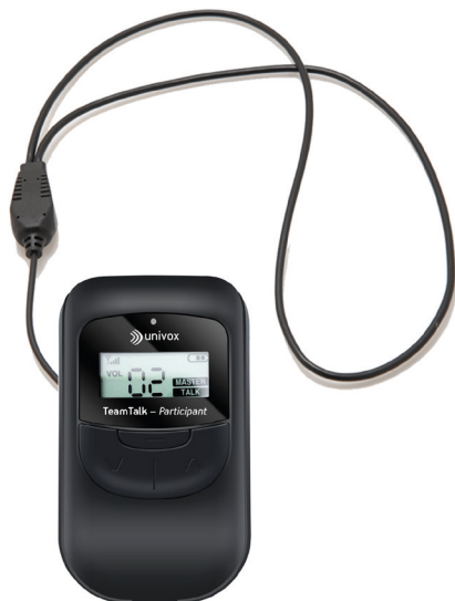
TeamTalk-P med NL-90 hals slinga