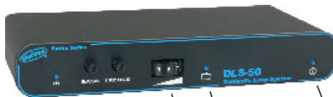
UNIVOX DLS-50, den vanligste

Art. nr.: 1104381: CTC 120 DLS-50, 13V og puteslynge