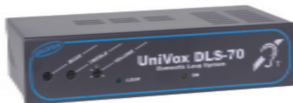
UNIVOX DLS-70 til metallskranker og større areal.

Art. nr.: 1104383: CTC 123 DLS-70, M1 og puteslynge