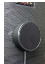
Art.nr. 1104141, mikrofon med 3.5mm-propp. Festes på høyttalerfronten.