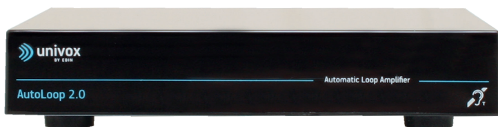
Univox® AutoLoop 2.0