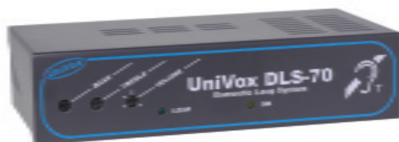
UNIVOX DLS-70 til metallskranker og større areal.